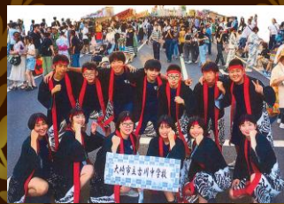
「古川中学校まちづくり学習」 古川中学校まちづくり学習